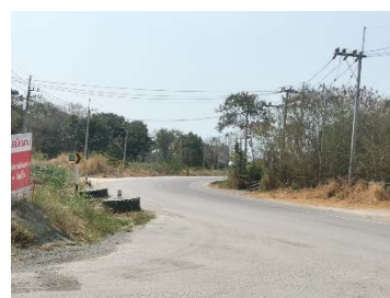
ทางหลวงหมายเลข 3144