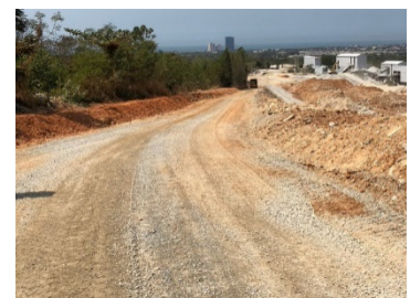
เส้นทางขนส่งแร่ระหว่างหน้าเหมือง-โรงโม่หิน