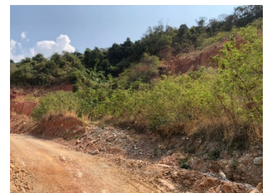
แนวเวนไม่ทำเหมือง