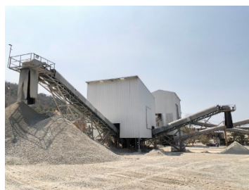
พื้นที่โรงโม่หินของโครงการ