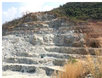
พื้นที่หน้าเหมืองปัจจุบัน

พื้นที่โครงการ ประทานบัตรที่ 21378/15248